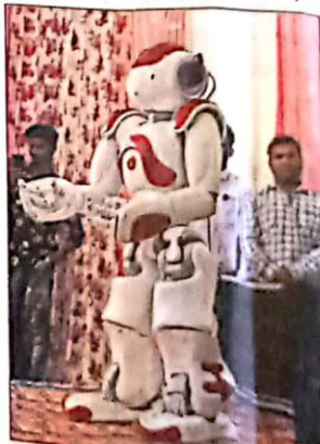
यह रोबोट देगा जानकारी।

सभी मेट्रो स्टेशनों पर सेनेटरी नेपकिन वैंडिंग मशीन लगाई गई है। इस मशीन को संचालित करने के लिए टोकन सभी स्टेशनों के कस्टमर केयर काउंटर पर उपलब्ध होंगे। इन मशीनों को मास एनजीओ ने अपने अभियान निर्मल्य-एक कोमल पहल के तहत एसीई ग्रुप के सहयोग से स्थापित किया है। ये सभी सुविधाएं महिलाओं को मुफ्त में दी जाएगी।