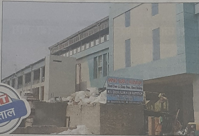
सेक्टर-78 मेट्रो स्टेशन के सामने कबाड़ की दुकान हो सकती है खतरनाक

“ कालिंदी कुंज जैसी घटना नोएडा में न हो, इसके लिए नोएडा अथॉरिटी से बात कर योजना बनाई जाएगी। मेट्रो परिसर में आग से बचाव के सभी इंतजाम दुरुस्त हैं। -संध्या शर्मा, पीआरओ, एनएमआरसी